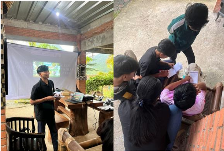
Gambar 4. Penyusunan Paket Wisata dan Presentasi oleh Peserta

Selain peningkatan pengetahuan, kegiatan ini menghasilkan capaian praktis berupa kemampuan peserta dalam menyusun paket wisata all-in yang mencakup trekking, aktivitas pendukung, konsumsi lokal, dan penginapan. Paket wisata disusun dengan mempertimbangkan karakteristik wisatawan dari luar kota yang membutuhkan layanan terpadu dan aman. Capaian ini menunjukkan meningkatnya kemampuan peserta dalam mengintegrasikan potensi lokal, sumber daya manusia, dan fasilitas pendukung ke dalam produk wisata bernilai ekonomi. Proses penyusunan paket wisata serta presentasi hasil kerja peserta dapat dilihat pada Gambar 4.