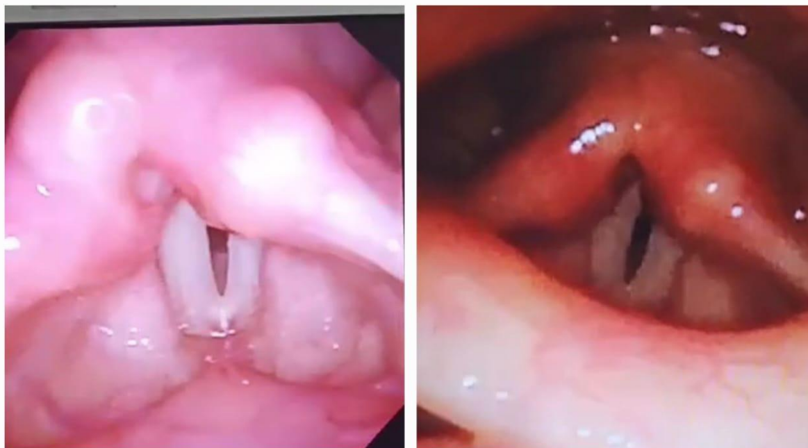
Gambar 2. Laringoskopi sebelum terapi (kiri) dan setelah terapi ke-10 (kanan)

Efek samping yang dirasakan pasien sangat minimal, yaitu kadang-kadang terasa sensasi penusukan jarum pada beberapa titik.