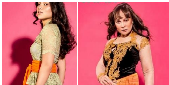
Gambar 4. Penggunaan kebaya dalam foto Bersama Sisters

Berikutnya adalah cara identitas perempuan itu ditampilkan di dalam foto. Kumpulan foto dalam gerakan Bersama Sisters yang diunggah di akun Instagram Omroep Bersama menunjukkan satu kesamaan pada latar warnanya, yaitu warna merah muda. Warna merah muda identik dengan feminin atau hal-hal yang berkaitan dengan perempuan. Pemikiran itu berangkat dari pemahaman umum yang ada di masyarakat. Sebagai contoh, ketika ada peristiwa kelahiran, rumah sakit biasanya menyediakan topi merah muda untuk anak perempuan dan topi biru untuk anak laki-laki, atau memberikan tanda visual dari jenis kelamin yang telah ditetapkan pada bayi (Eckert & McConnell-Ginet, 2013). Di Amerika Serikat, jika seseorang hendak membeli hadiah untuk bayi yang baru lahir, biasanya akan ditanya apakah bayi itu laki-laki atau perempuan. Pertanyaan itu muncul untuk menentukan hadiah yang tepat, misalnya baju warna merah muda untuk bayi perempuan yang artinya feminin.