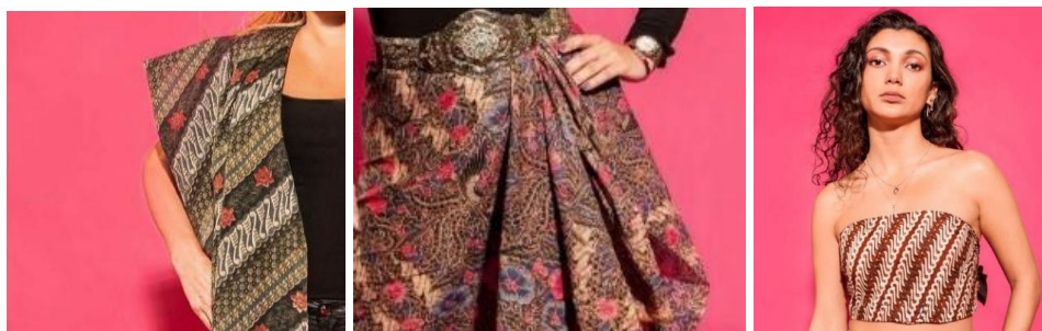
Gambar 3. Penggunaan batik dalam foto Bersama Sisters

Selain dari segi teks, ada aspek visual yang mendukung identitas Indo. Aspek visual itu dapat dilihat dari busana yang digunakan oleh para perempuan ini. Mereka menggunakan batik, baik sebagai baju, rok, atau aksesoris. Pemakaian batik merupakan cara menunjukkan identitas Indo dan sebagai bentuk identifikasi bahwa mereka mengakui sisi Indonesia dalam diri mereka. Pemakaian batik ini menjadi identitas yang dapat dilihat. Selain batik, beberapa perempuan juga memakai kebaya dan memegang atribut seperti kipas.