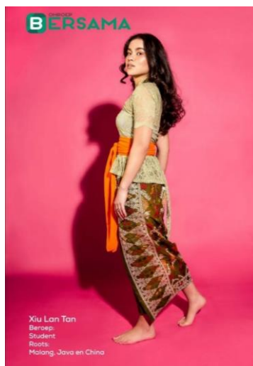
Gambar 1. Salah satu foto perempuan Indo dalam gerakan Bersama Sisters oleh Omroep Bersama

Instagram dengan nama pengguna @omroepbersama. Omroep Bersama mengadakan gerakan Bersama Sisters dengan tagar #femalepower yang berisi 12 foto perempuan Indo atau keturunan Indo. Tiap foto disertai keterangan nama, pekerjaan, dan asal keturunan.