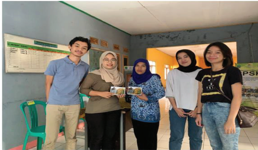
Gambar 3. Penyerahan booklet wisata kepada sekretaris Desa Cijedil