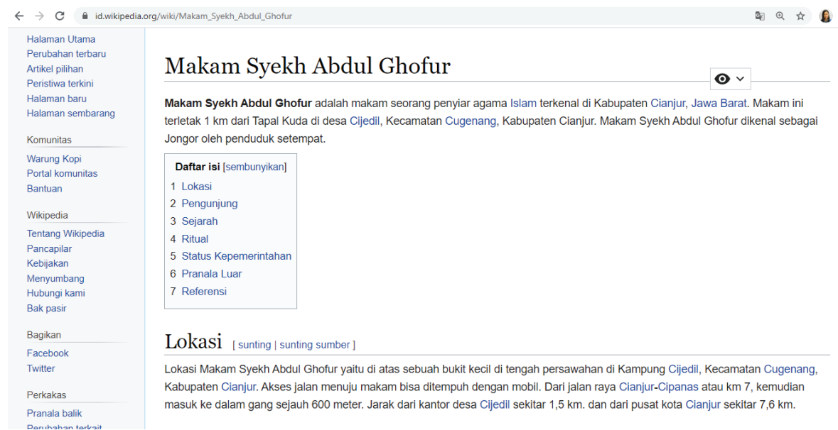
Gambar 1. Cetak layar wikipedia pada laman Syekh Abdul Ghofur

Berikut adalah pranala wikipedia Makam Syekh Abdul Ghofur hasil suntingan terakhir.