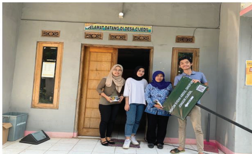
Gambar 4. Penyerahan plang signage kepada perangkat Desa Cijedil

Gambar 4 merupakan dokumentasi penyerahan signage kepada pihak desa untuk dipasang sesuai dengan lokasi yang disepakati sehingga memberikan petunjuk yang jelas mengenai keberadaan lokasi makam.