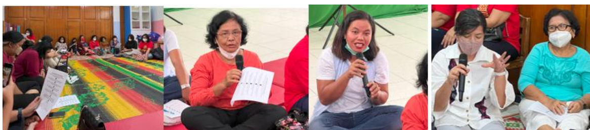
Gambar 3. Narasumber dan peserta saat penjelasan mengenai tempe sebagai bahan pangan berkualitas dan berdampak baik bagi kesehatan serta tahapan pembuatannya.

Tempe juga diketahui mampu mendukung pembentukan mikrobiota usus yang sehat, menjadikannya sebagai pangan fungsional yang berperan penting dalam menjaga keseimbangan sistem pencernaan (Stephanie et al. , 2017). Dalam sesi ini turut disampaikan bahwa tempe merupakan makanan khas Indonesia yang telah dikenal dan diproduksi di berbagai negara karena kandungan gizinya serta manfaat fungsionalnya yang luas. Seluruh materi disampaikan dengan menggunakan bahasa yang sederhana dan mudah dipahami, disesuaikan dengan latar belakang peserta yang sebagian besar berasal dari kalangan non-akademik. Para peserta tampak antusias selama kegiatan berlangsung, ditunjukkan dengan banyaknya pertanyaan yang diajukan kepada narasumber. Dari diskusi yang berlangsung, terlihat bahwa pengetahuan peserta mengenai keunggulan tempe sebagai bahan pangan bergizi dan fungsional masih relatif terbatas (Gambar 3).