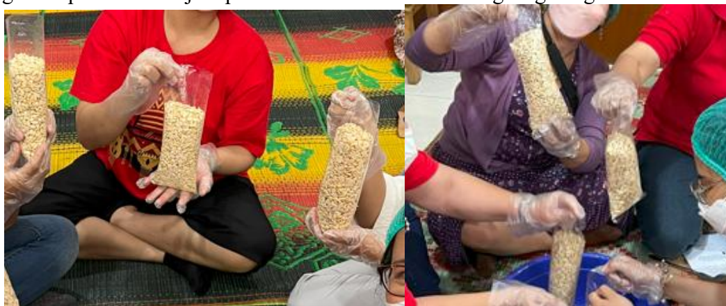
Gambar 8. Para peserta kegiatan sedang melakukan pengemasan kedelai yang telah dicampur inokulum/ragi pada plastik berlubang

Fermentasi pada tahap ini berlangsung selama kurang lebih 48 jam. Ciri tempe yang baik antara lain adalah warna putih yang merata, tekstur padat dan kompak, serta bentuk yang mengikuti kemasan. Tempe yang berkualitas juga memiliki aroma khas yang segar, tidak berbau asam atau busuk. Kegagalan dalam proses ini sering ditandai dengan bau busuk yang menyengat, yang umumnya terjadi karena kontaminasi mikroba pembusuk atau kegagalan fermentasi akibat kurangnya aerasi. Hal ini penting diperhatikan, mengingat kedelai mengandung protein tinggi, sekitar 40% dari bobot kering, sehingga sangat rentan mengalami pembusukan jika proses fermentasi tidak berlangsung dengan baik.