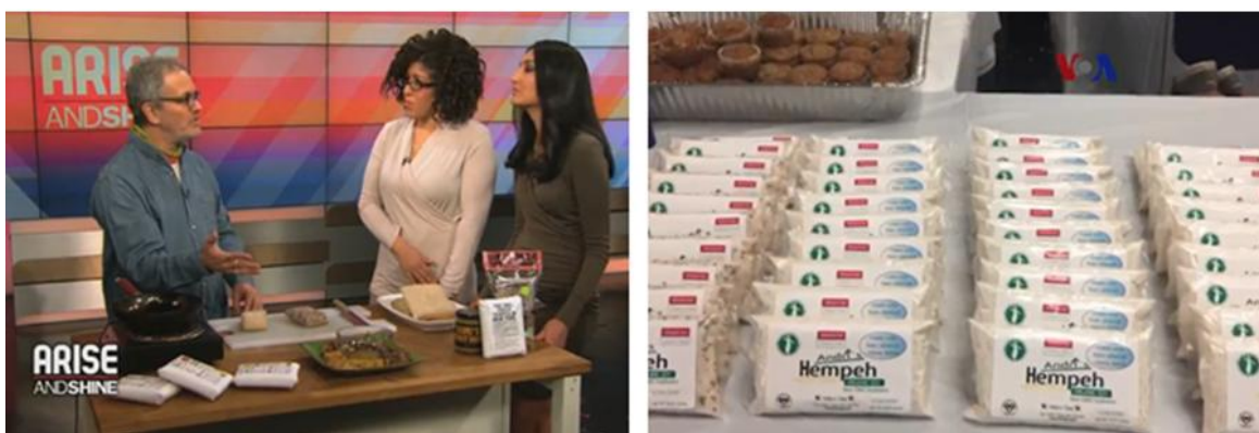
Gambar 4. Edukasi produksi tempe di Amerika Serikat. 1

Pemaparan ini bertujuan untuk mengubah persepsi sebagian masyarakat yang masih menganggap tempe sebagai bahan pangan murah, mudah diperoleh, dan identik dengan konsumsi masyarakat berpenghasilan rendah. Sebaliknya, peserta diharapkan memahami bahwa tempe merupakan pangan bergizi tinggi yang memiliki potensi besar untuk dikembangkan sebagai makanan sehat, fungsional, dan bernilai ekonomi tinggi.