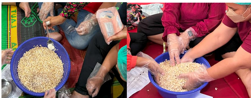
Gambar 7. Edukasi tahap pemberian inokulum atau ragi

Kedelai yang telah dicampur dengan inokulum kemudian dikemas dan diinkubasi pada suhu ruang dengan sirkulasi udara yang baik. Selama proses inkubasi, kapang Rhizopus akan tumbuh di permukaan kedelai, membentuk miselium berwarna putih yang menyelimuti dan mengikat seluruh butiran kedelai menjadi massa padat dan kompak, mengikuti bentuk dari kemasan yang digunakan.