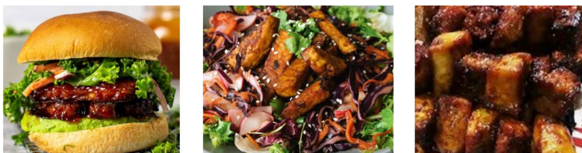
Gambar 5. Olahan tempe menjadi berbagai jenis bahan pangan di USA 2

Kepada peserta diinformasikan bahwa laru tempe tersebut dapat diperoleh melalui Koperasi Pengrajin Tempe setempat atau dibeli secara daring melalui platform e-commerce seperti Tokopedia, sehingga memudahkan masyarakat dalam mengakses bahan baku yang dibutuhkan untuk produksi tempe secara mandiri dan higienis.