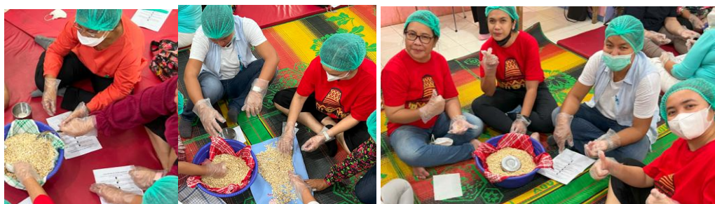
Gambar 6. Peserta melakukan pengupasan kedelai dalam kelompok masing masing

Para peserta dibimbing dalam tahap pencampuran inokulum (laru tempe) dengan kedelai yang telah dikupas dan dikeringkan (Gambar 7). Proses pencampuran ini harus dilakukan secara merata agar seluruh permukaan keping kedelai terlapisi oleh inokulum. Pengadukan dilakukan secara manual menggunakan tangan yang telah dicuci bersih guna menjaga higienitas produk.