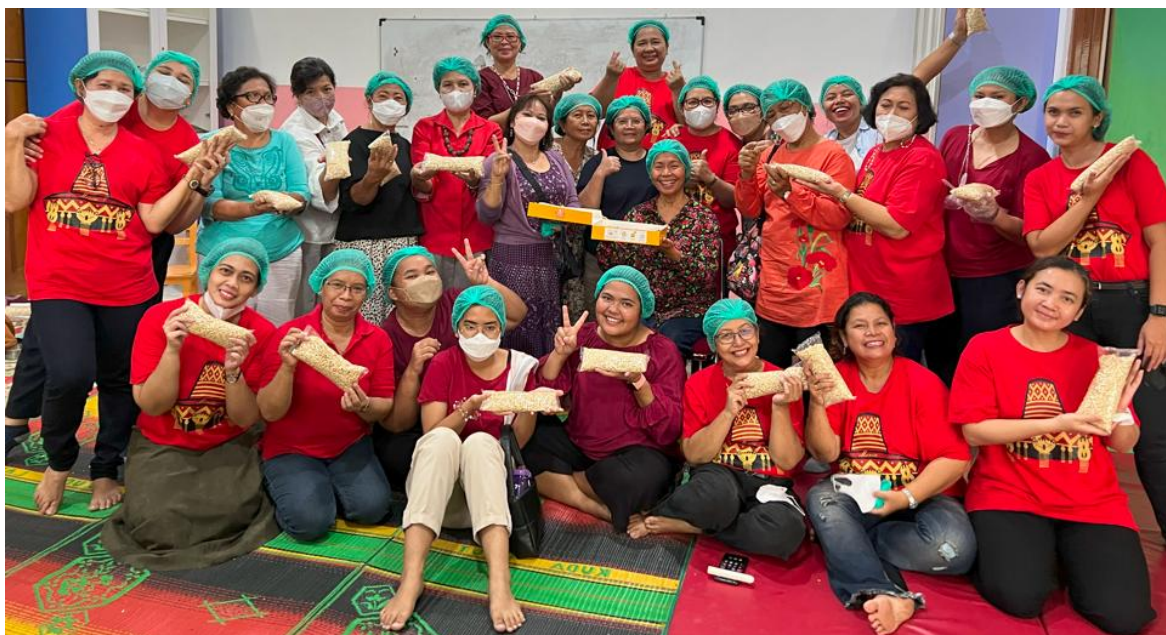
Gambar 2. Foto bersama narasumber dengan para ibu peserta pelatihan di akhir kegiatan.

Materi yang disampaikan dalam kegiatan ini berkaitan dengan tempe sebagai pangan berkualitas tinggi yang memberikan dampak positif bagi kesehatan. Seluruh materi bersumber dari berbagai hasil penelitian ilmiah mengenai tempe yang telah dipublikasikan di tingkat nasional maupun internasional. Di antaranya, tempe dikenal sebagai sumber protein nabati yang unggul (Mahdi et al. , 2022) dan mengandung berbagai nutrisi penting yang bermanfaat bagi tubuh (Ahnan-Winarno et al. , 2021). Beberapa studi juga menunjukkan bahwa konsumsi tempe dapat berkontribusi terhadap peningkatan fungsi kognitif, khususnya pada lansia (Handajani et al. , 2020; Turana et al. , 2025). Selain itu, tempe mengandung senyawa antioksidan yang berfungsi menangkal radikal bebas (Barus et al. , 2019), serta senyawa antidiare yang bermanfaat untuk kesehatan saluran pencernaan (Pramudito et al. , 2022).