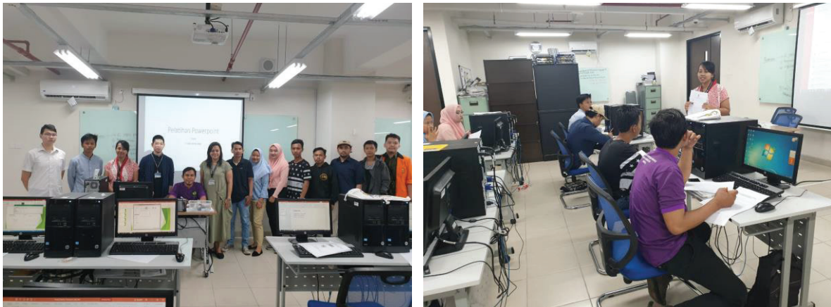
Gambar 1. Pelaksanaan Pelatihan Ms. Office Power Point

Pelatihan ini menggunakan modul yang dipersiapkan oleh tim. Modul pelatihan berisi tentang dasar-dasar Ms. Office Power Point , tool-tool yang ada, dan cara penggunaan Ms. Office Power Point untuk pembuatan presentasi. Dengan adanya modul pelatihan, peserta lebih mudah untuk memahami materi dan mendapat pedoman ke depannya dalam penggunaan Ms. Office Power Point . Gambar 1 menunjukkan situasi saat pelatihan berlangsung. Terlihat antusiasme dari para peserta pelatihan untuk mengikuti pelatihan dari awal hingga akhir. Berdasarkan kuesioner yang disebarakan terkait dengan penilaian terhadap materi, suasana, dan fasilitator yang menyampaikan, rata-rata nilai yang didapatkan adalah 4,7 (skala 1-5) yang berarti berada dalam range nilai baik-sangat baik.