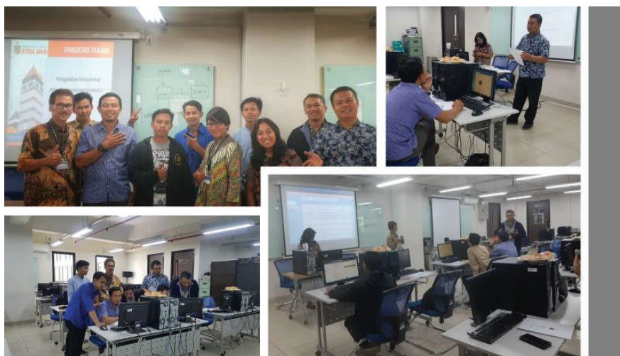
Gambar 3. Suasana Pelatihan Dasar Internet

Dari hasil survei pada Tabel 1, dapat dilihat bahwa tingkat kepuasan dinilai dari level 1 (terendah) – level 5 (tertinggi), rata-rata peserta memberikan nilai 5 untuk proses dan teknis pengajaran dari kegiatan pengabdian ini. Gambar 3 menunjukkan sebagian suasana pelatihan dasar internet yang sudah dilakukan.